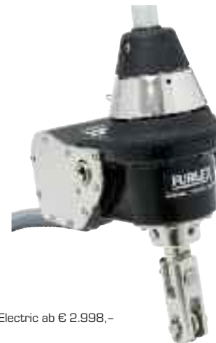
Furlex Electric ab € 2.998,-

Das Aus- und Einrollen des Vorsegels per Knopfdruck schafft Komfort und Sicherheit. Auf Yachten ab 36 Fuss können Sie Ihre Segel mit dieser Hilfe kraftsparend beherrschen. Und die Investitionskosten bleiben dabei im Rahmen. Denn die meisten vorhandenen Rollreffanlagen können wir jederzeit mit einem Elektroantrieb nachrüsten.