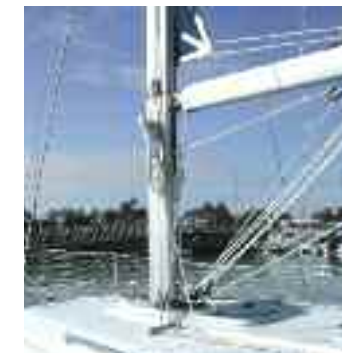
z.B. eine Grosssegelrollreffanlage zum Nachrüsten, ab € 3.475,-

Die stufenlose Bedienung des Grosssegels machen Wind und Wetter gerade für ältere Crews oder grössere Yachten leicht beherrschbar. Geniessen Sie den gleichen Komfort, wie bei einer Vorsegelreffanlage und bedienen Sie auch Ihr Grosssegel vom geschützten Cockpit aus. Und mit unseren modernen Schnitten und durchgehende Segellatten bleibt das Rollgrossegel leistungsfähig.