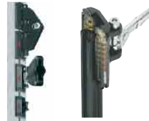
Ronstan Ballslide ohne Schiene ab € 1.250,-

Sparen Sie Kraft und Zeit beim Setzen und Bergen Ihres Grosssegels. Wir empfehlen gelagerte Rutschersysteme für die Verminderung von Reibung bis zu 90%. Im Zusammenspiel mit einem Lazy-Jack-System fällt das Grosssegel geordnet innerhalb weniger Sekunden und ist anschliessend durch wenige Handgriffe fertig aufgetucht.