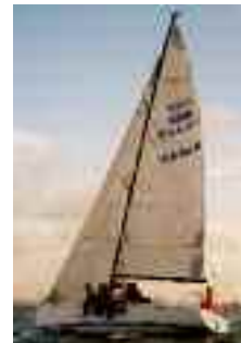
THUNDER mit Cuben Fiber Grossegegel und Fock

Das Ergebnis ist ein ausserordentlich weiches Material mit hoher Lebensdauer, grosser UV-Beständigkeit und unvergleichbar niedrigem Gewicht.