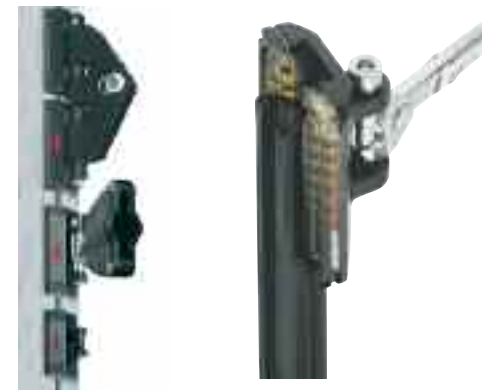
Ronstan Ballslide ohne Schiene ab € 1.250,-

Sparen Sie Kraft und Zeit beim Setzen und Bergen Ihres Grosssegels. Wir empfehlen gelagerte Rutschersysteme für die Verminderung von Reibung bis zu 90%. Im Zusammenspiel mit einem Lazy-Jack-System fällt das Grosssegel geordnet innerhalb weniger Sekunden und ist anschliessend durch wenige Handgriffe fertig aufgetucht.