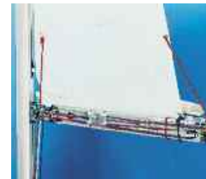
Automatikreiff im Baum ab € 1.890,- Einleinenreff zum Nachrüsten bis 34 Fuss: € 143,-/Reff

Auch bei herkömmlichen Segeln können Sie sich das Verlassen des Cockpits bei schwerer See ersparen. Mit einem Einleinenreffsystem bedienen Sie Reffhals und Reffschot gleichzeitig und bequem mit einer Leine vom Cockpit aus. Yachten mit bisher herkömmlich am Mast geführten Leinen rüsten wir selbstverständlich um und lenken die Leinen ins Cockpit.